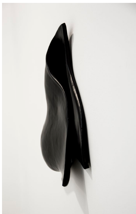
سرامیک با لعاب ۱۳۹۴