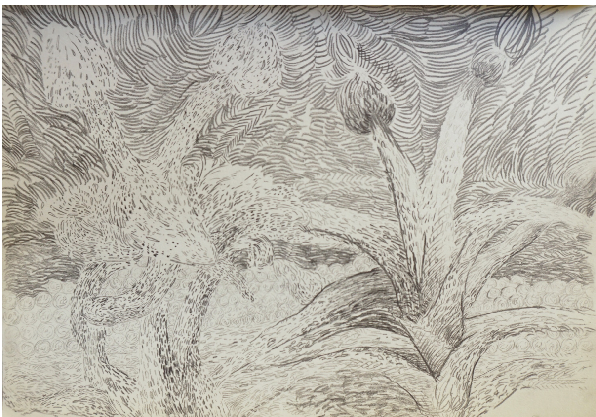
مداد روی کاغذ ۲۰×۲۸ سانتی متر ۱۳۹۴