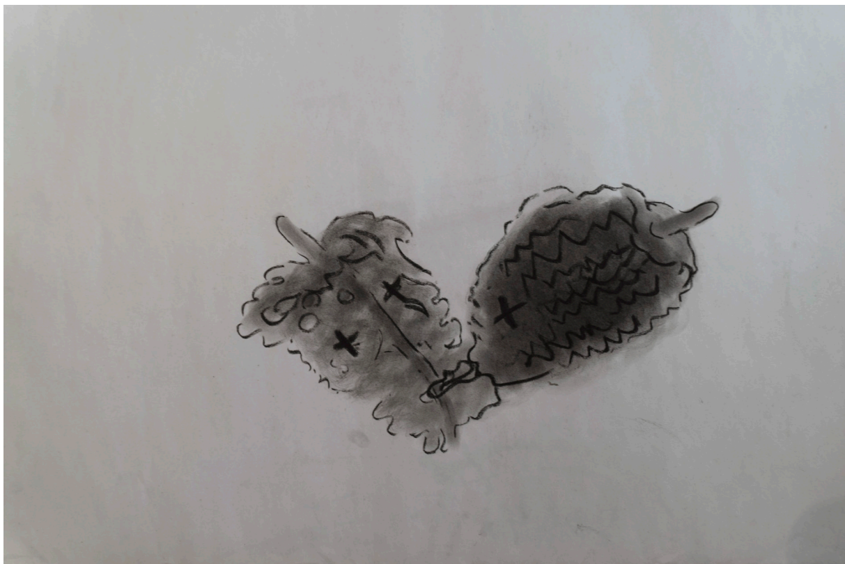
زغال روی کاغذ ۵۰×۷۰ سانتی متر ۱۳۹۵