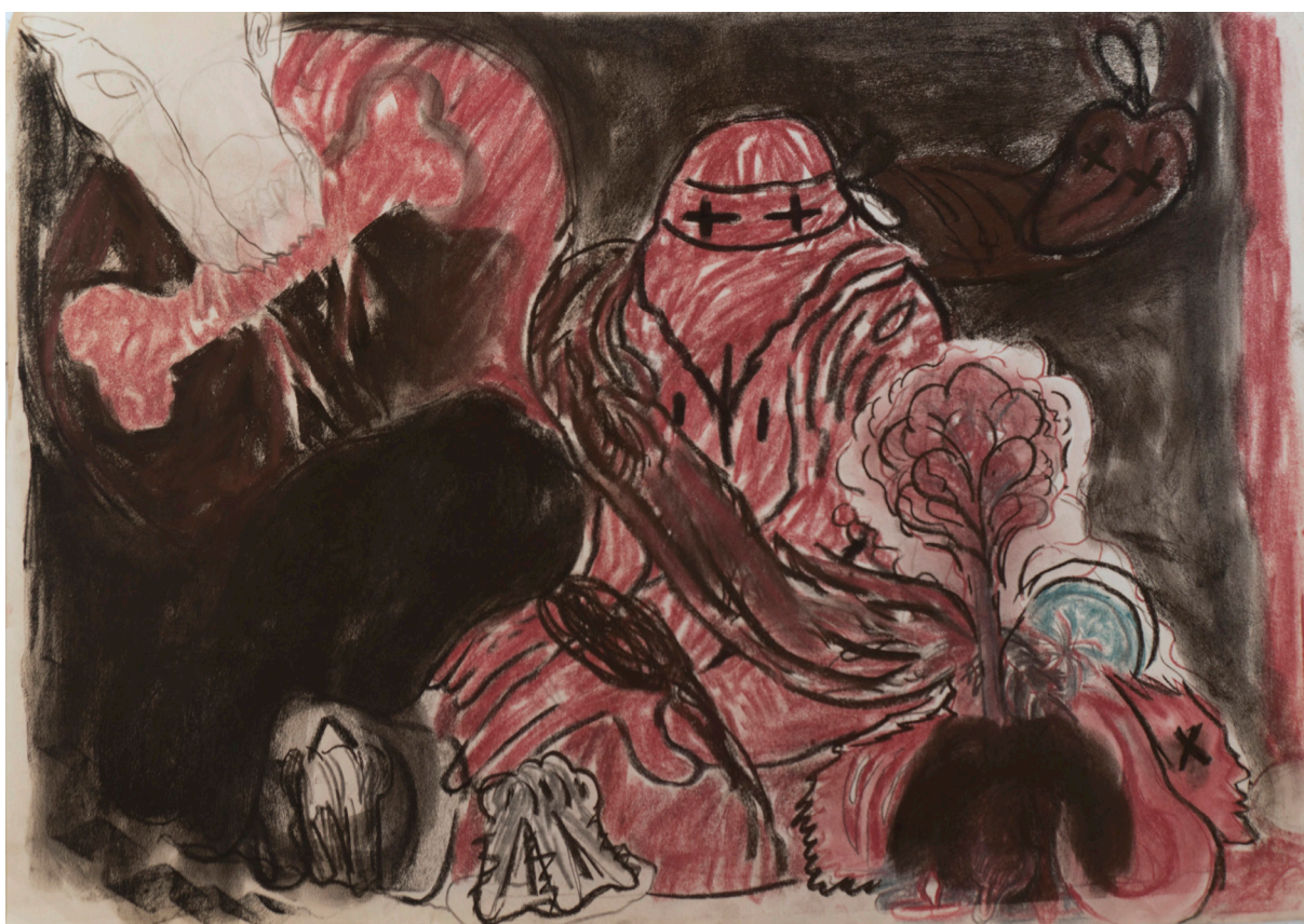
پاستل روی کاغذ ۵۰×۷۰ سانتی متر ۱۳۹۵