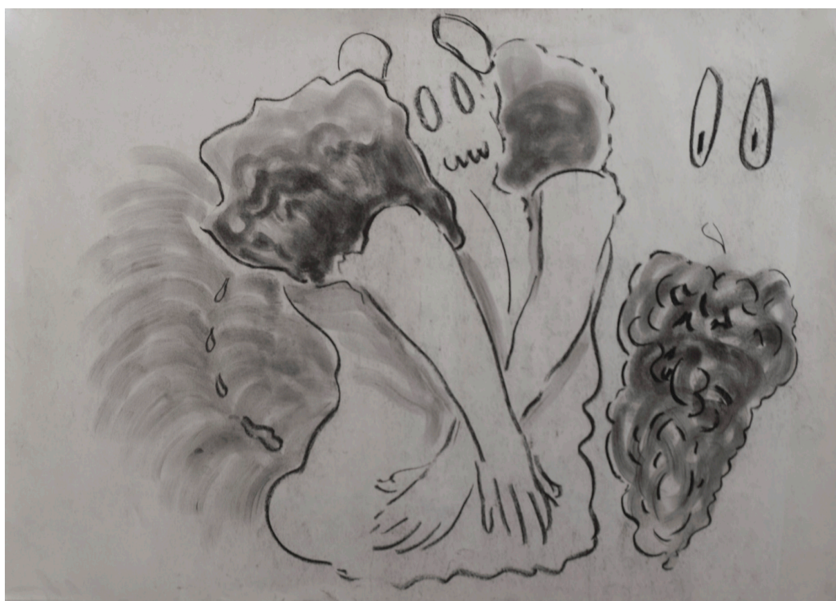
زغال روی کاغذ ۵۰×۷۰ سانتی متر ۱۳۹۵