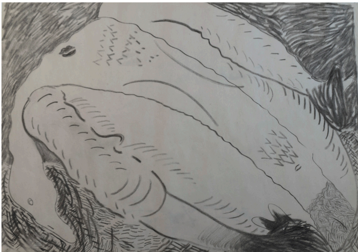
پاستل روی کاغذ ۵۰×۷۰ سانتی متر ۱۳۹۵