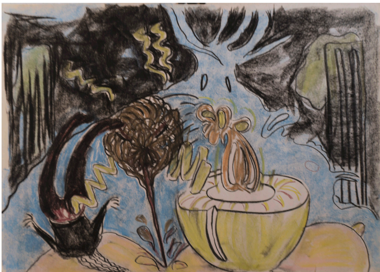
پاستل روی کاغذ ۵۰×۷۰ سانتی متر ۱۳۹۵