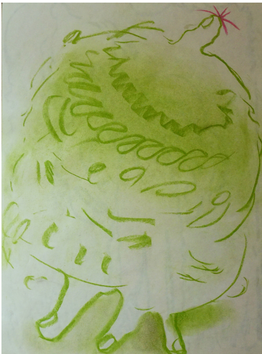
پاستل روی کاغذ ۳۰×۲۰ سانتی متر ۱۳۹۵