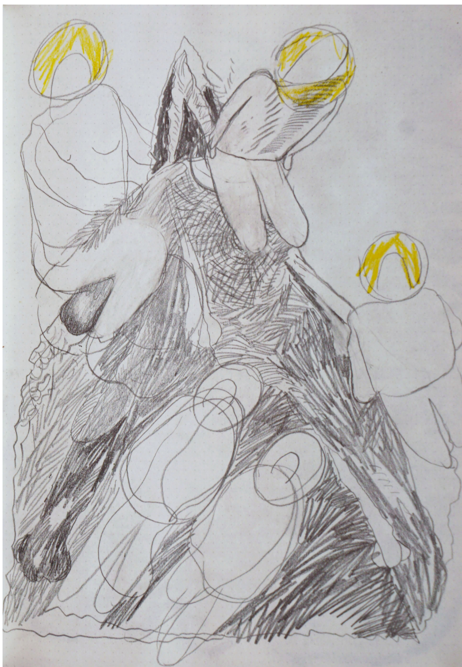
مداد روی کاغذ ۲۰×۳۰ سانتی متر ۱۳۹۵