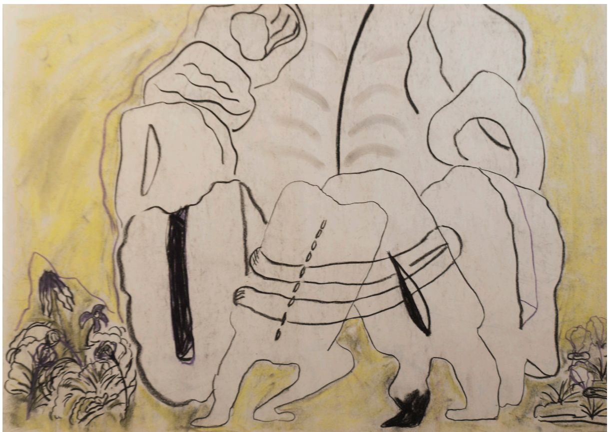
پاستل روی کاغذ ۵۰×۷۰ سانتی متر ۱۳۹۵