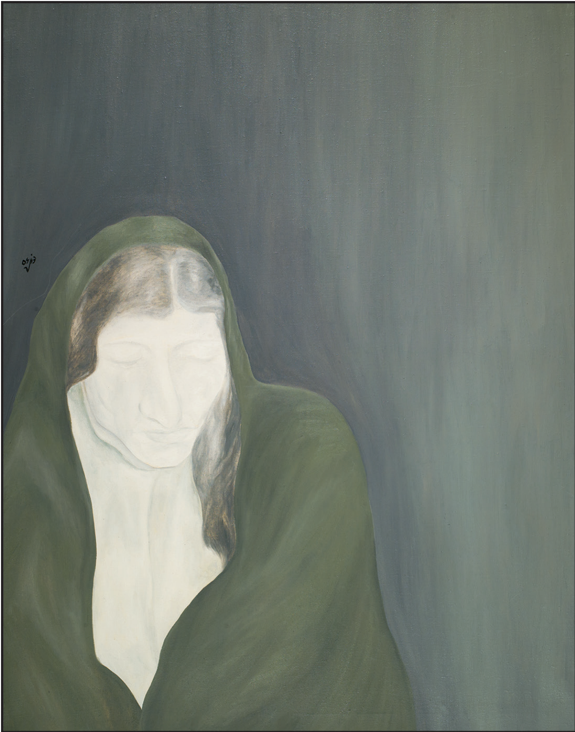
بدون عنوان ۱۳۵۶ ۱۱۰×۸۵ سانتی متر رنگ روغن روی بوم