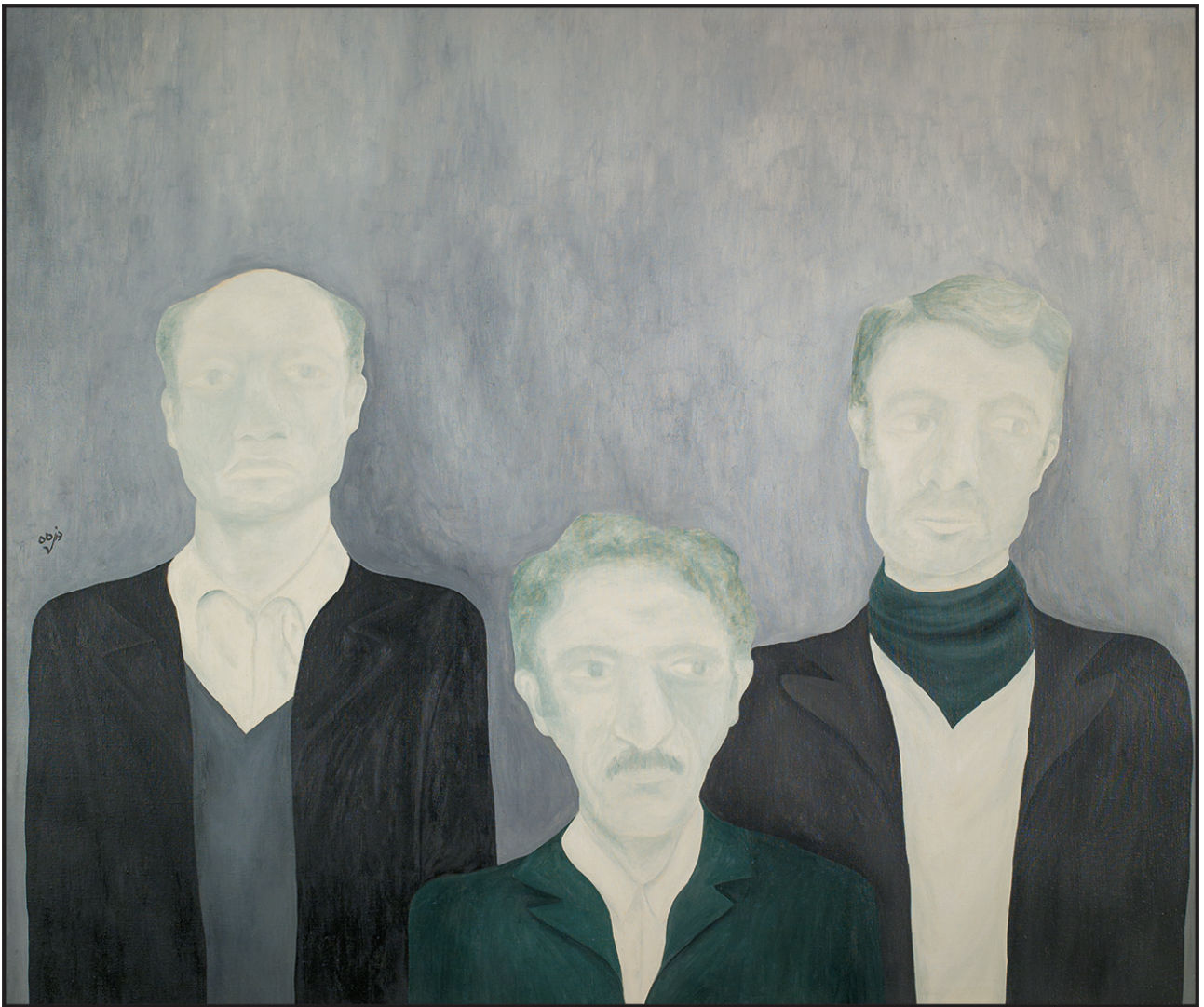
بدون عنوان ۱۳۵۵ ۱۱۰×۱۳۰ سانتی متر رنگ روغن روی بوم