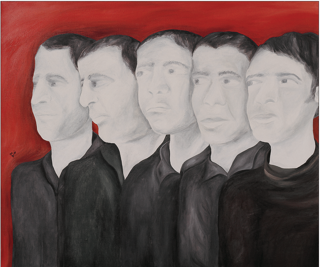
بدون عنوان ۱۳۵۵ ۱۱۰×۱۳۰ سانتی متر رنگ روغن روی بوم