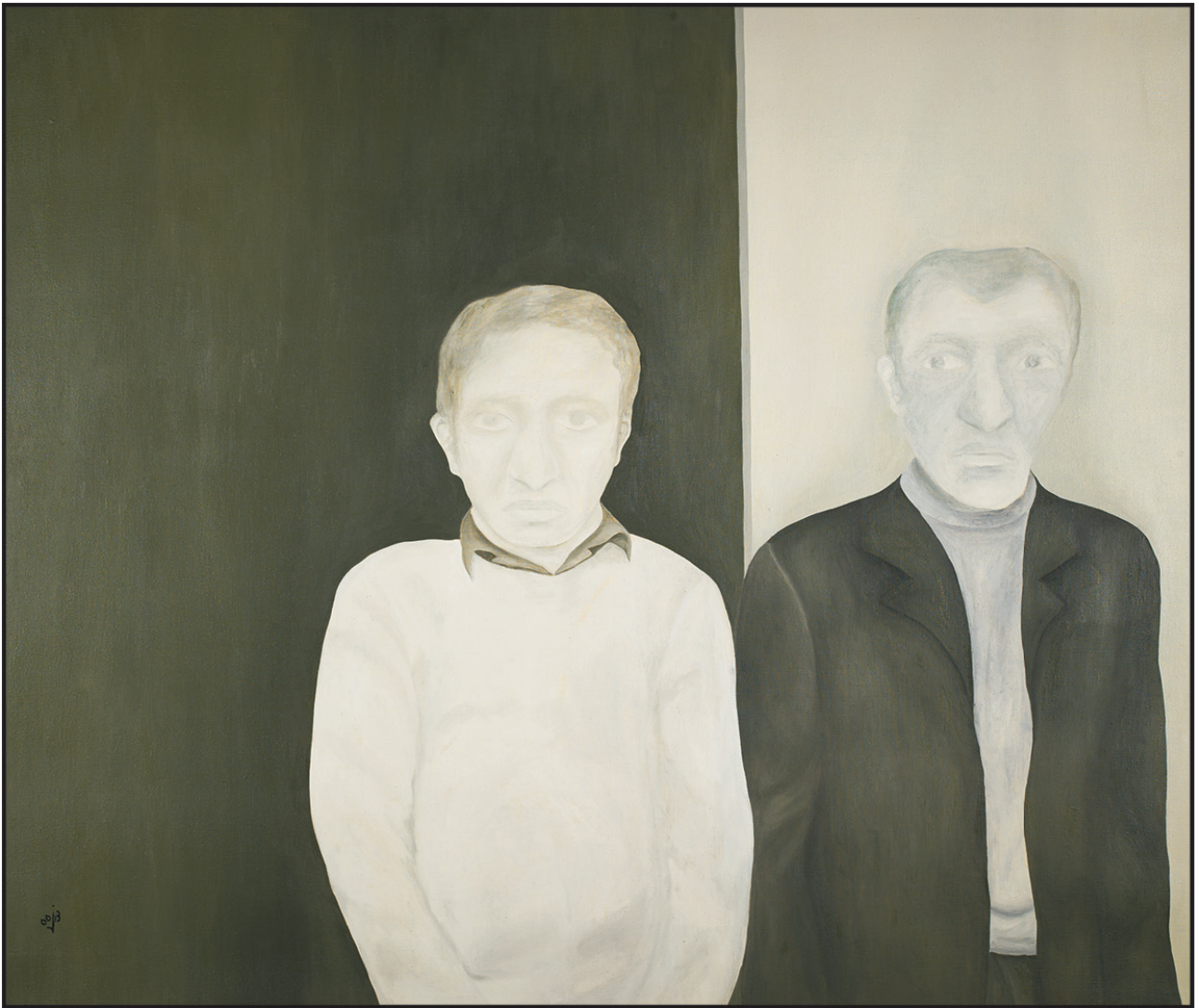
بدون عنوان ۱۳۵۵ ۱۱۰×۱۳۰ سانتی متر رنگ روغن روی بوم