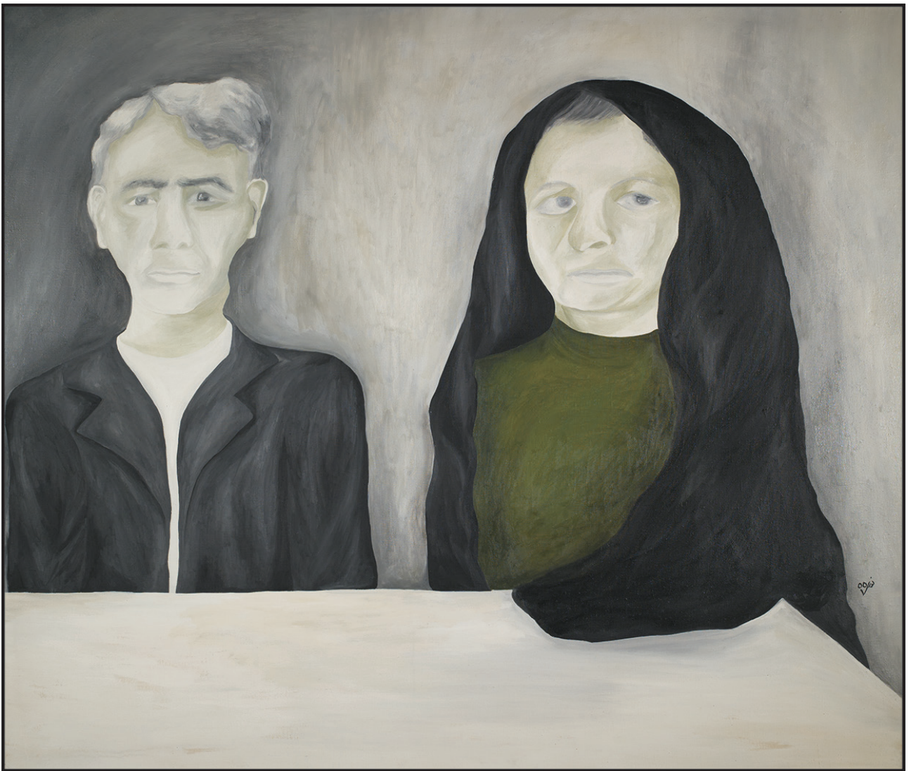
بدون عنوان ۱۳۵۵ ۱۱۰×۱۳۰ سانتی متر رنگ روغن روی بوم