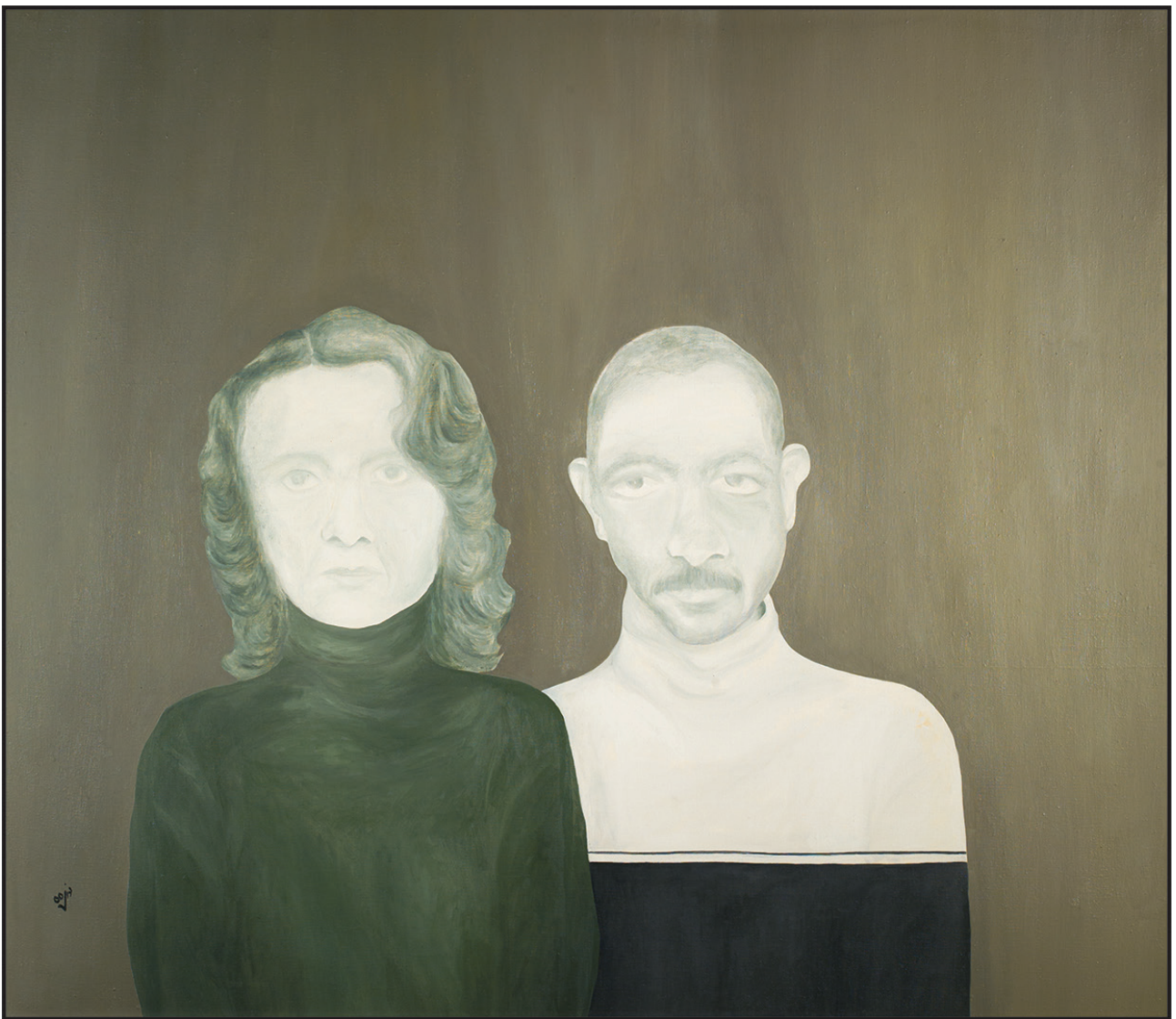
بدون عنوان ۱۳۵۵ ۱۱۰×۱۳۰ سانتی متر رنگ روغن روی بوم