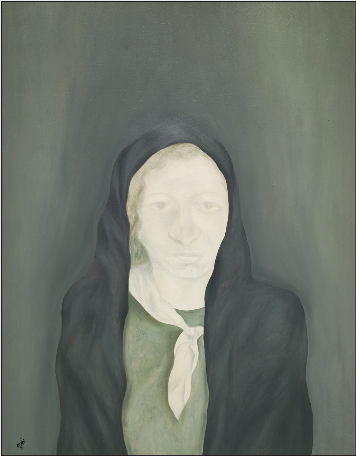
بدون عنوان ۱۳۵۶ ۱۱۰×۸۵ سانتی متر رنگ روغن روی بوم